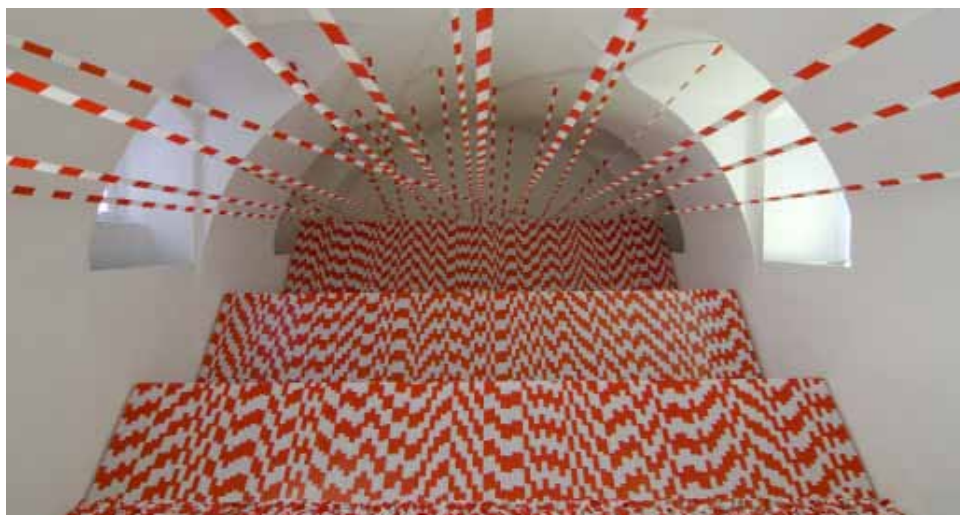
Pohled do instalace Ivana Kafky Míra snesitelnosti