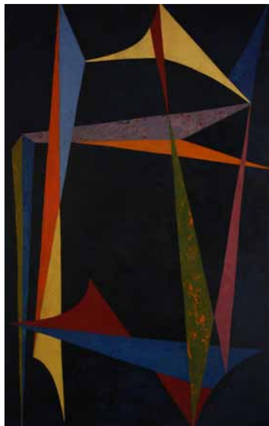
Miloš Saxl Architektura 1965

Abstraktně pojaté panneau, symbolizující disciplínu architektury, vytvořil Miloš Saxl (1921–1992), malíř a bývalý ředitel Galerie moderního umění v Roudnici nad Labem (1958–1981), ve spolupráci s akademickým malířem Janem Kalousem (1920–1976) jako dekoraci foyer nově otevřené roudnické galerie (1965). Protějškem tomuto nástěnnému panó, provedenému technikou stuccolustro, byla skleněná vitráž představující malířství. Počátkem roku 2012 se GMU rozhodla zaevidovat toto dílo do svých sbírek pod názvem Architektura .