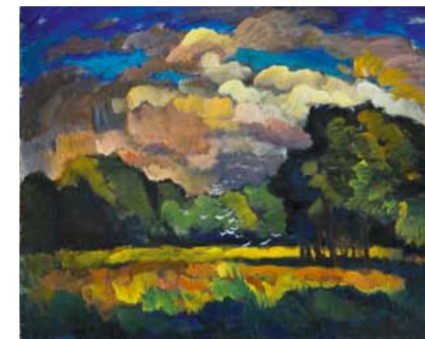
Otakar Nejedlý Ze Stromovky 1917