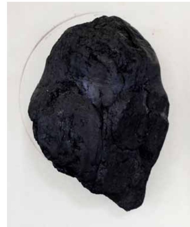
Dagmar Šubrtová Budečská Venuše (2011)