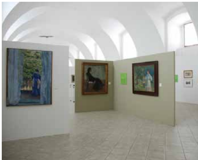
Pohled do výstavy Miloš Jiránek (1875–1911) / Zápas o moderní malbu