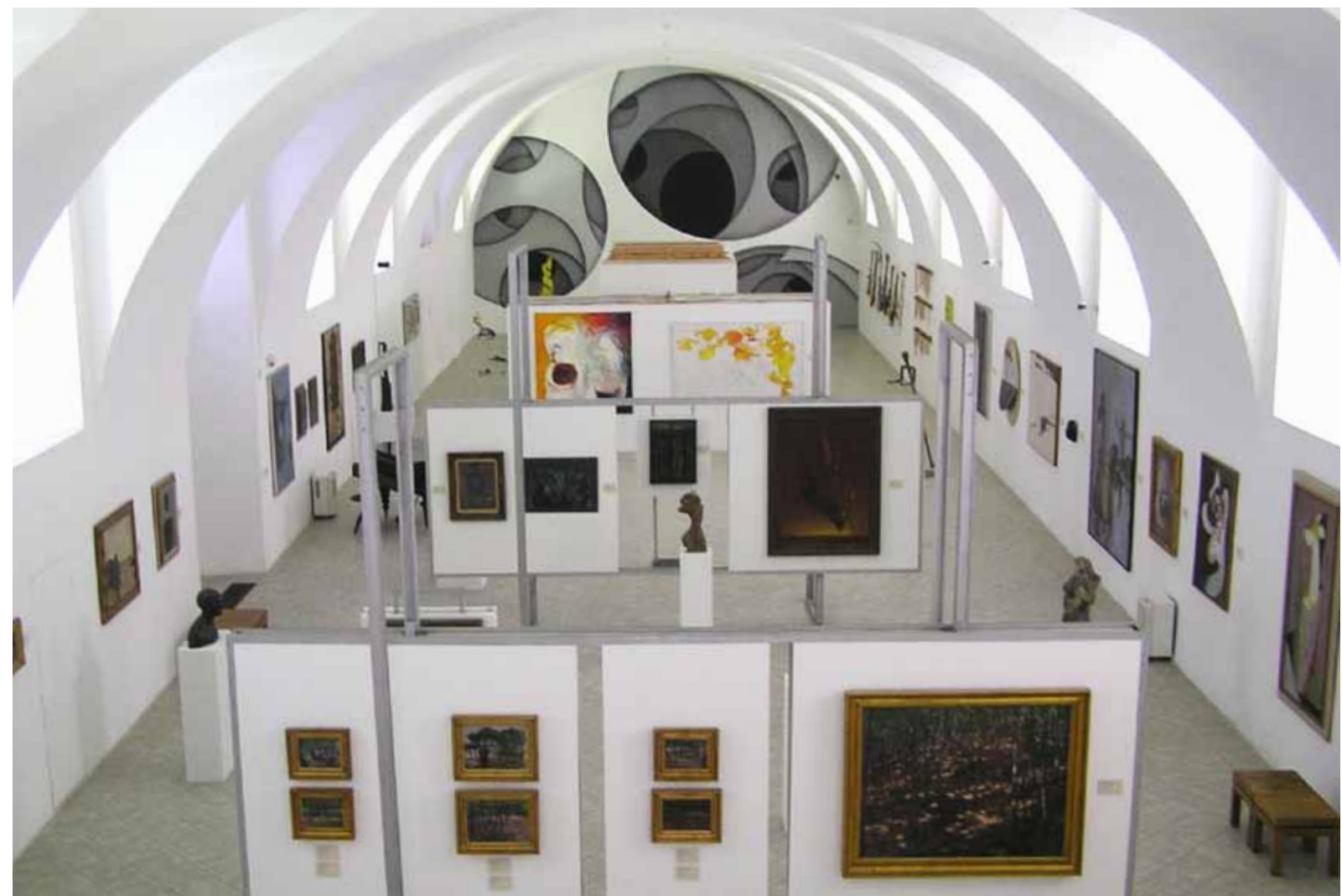
Nová tvář stálé expozice Galerie moderního umění 2012 s pohledem na nástěnnou malbu Jana Kalába