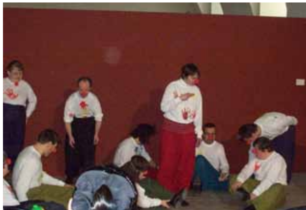
Divadlo Oáza s představením Circus ad Absurdum