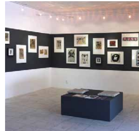
Pohled do výstavy Jan Křížek / Síla znaku