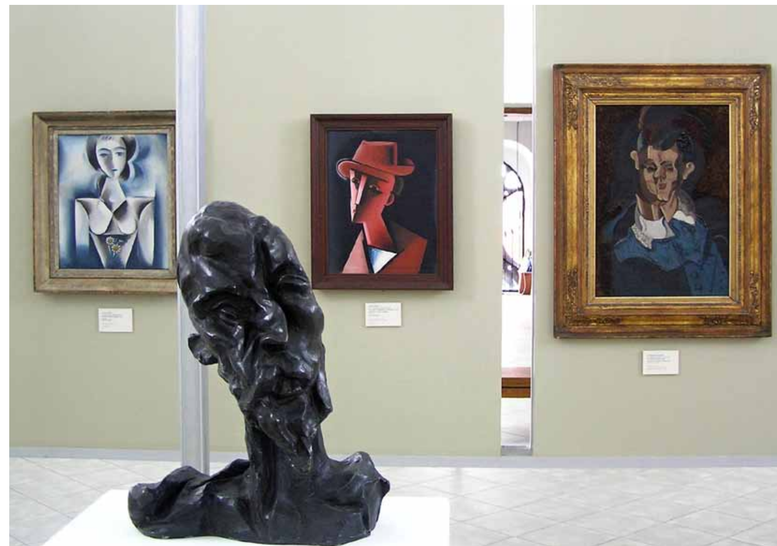
Pohled do stálé expozice s kolekcí kubistických portrétů